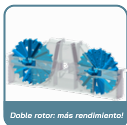
Doble rotor: más rendimiento!