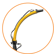
Comando hidráulico completo

E Como grande novidade, apresentamos o novo Sistema de Processamento de Grãos +PRO, que rompe o grão e potencializa o valor nutricional da silagem.