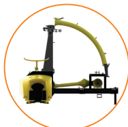
Bica dobrável para transporte