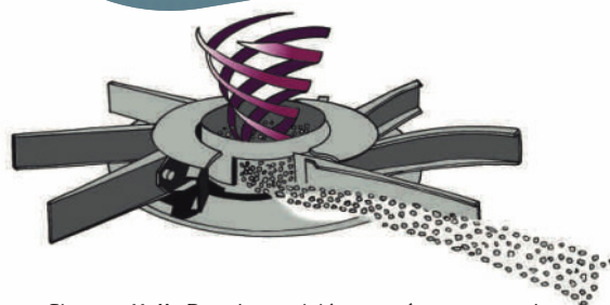
Sistema Helix Duo de precisión con cámara central: Flujo más suave para distribución con menos polvo y ahorro de fertilizante/semilla.