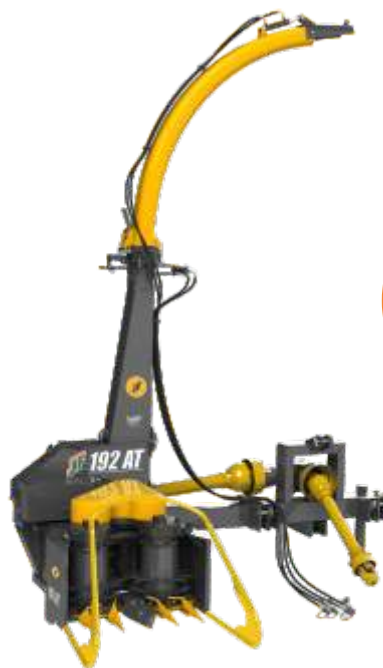
Cuchillas de corte 10x más rápidas que el tambor recogedor

Perfecto acoplamiento en la Cosechadora JF 192.