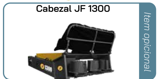
Cabezal JF 1300