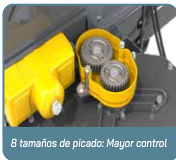
8 tamaños de picado: Mayor control