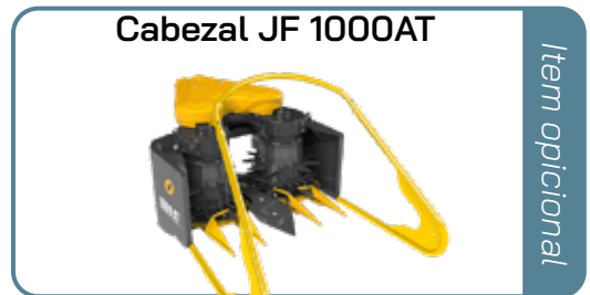
Cabezal JF 1000AT