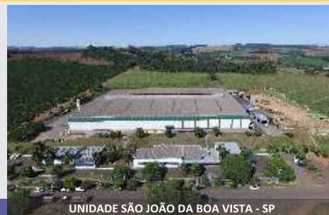
UNIDADE SÃO JOÃO DA BOA VISTA - SP

Linha de Colhedoras JF, a solução para o produtor!