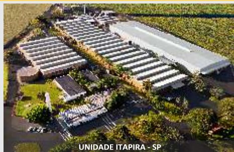
UNIDADE ITAPIRA - SP

Mais qualidade e rentabilidade para colheita de duas linhas.