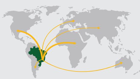
DESDE BRASIL PARA MÃS DE 50 PAÍSES EN TODOS LOS CONTINENTES