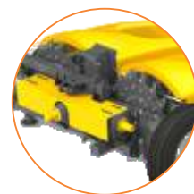
Dos rotores de 12 cuchillas cada uno