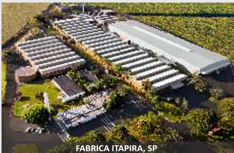
FABRICA ITAPIRA, SP

Sencillez y rendimiento en un solo equipo!