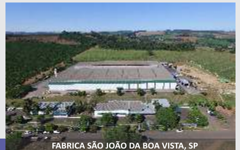
FABRICA SO JOO DA BOA VISTA, SP

Lnea de Cosechadoras de Forraje JF, la solucin para el ganadero!