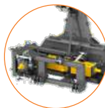
Caja trasera y brazo plegable para posición de transporte y cosecha de reversa