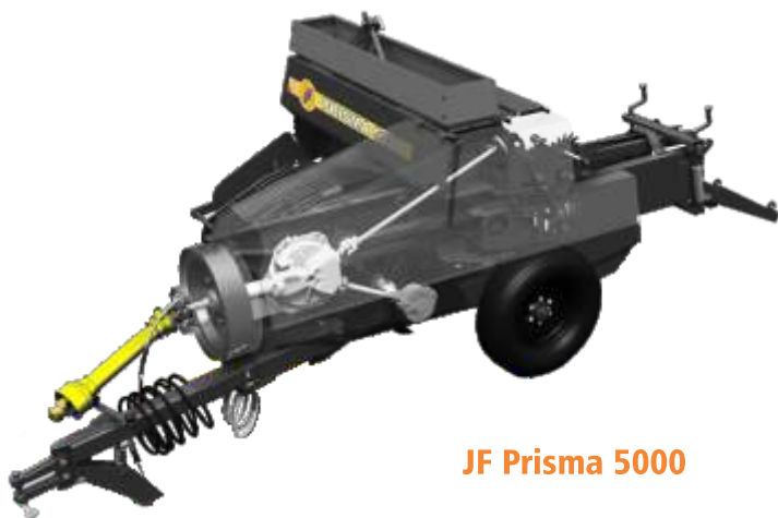
JF Prisma 5000