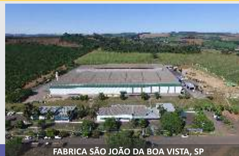
FABRICA SÃO JOÃO DA BOA VISTA, SP

Línea de Henificación JF, la solución para el ganadero!