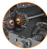
Transmissão por engrenagens e eixo