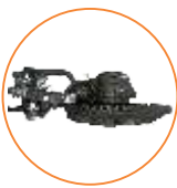
Nosador alemão Rasspe