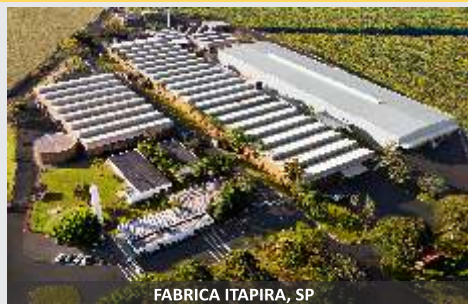
FABRICA ITAPIRA, SP