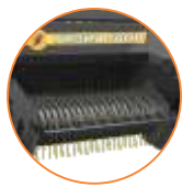
Pick-Up de 1,73m (Prisma 5000)

OBS: Consulte a su distribuidor para saber qué elementos son estándar y cuales son opcionales.