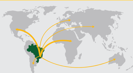
DESDE BRASIL PARA MÁS DE 50 PAÍSES EN TODOS LOS CONTINENTES