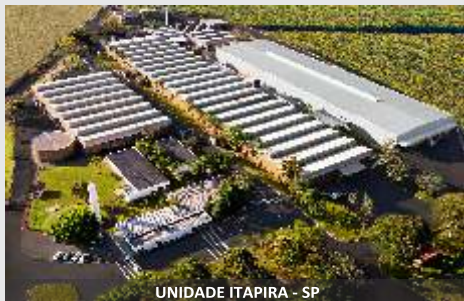
UNIDADE ITAPIRA - SP