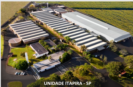
UNIDADE ITAPIRA - SP