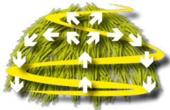
Ilustração do eficiente fluxo de mistura