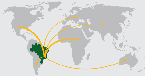
DO BRASIL PARA MAIS DE 50 PAÍSES