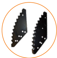
Facas especiais para corte de fibra larga