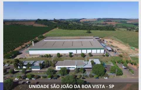
UNIDADE SÃO JOÃO DA BOA VISTA - SP

Linha de Mixers JF, a solução para o produtor!