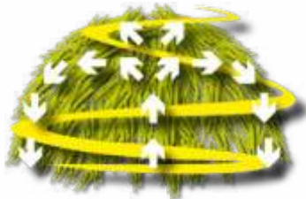
Ilustração do eficiente fluxo de mistura