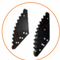
Facas especiais para corte de fibra larga