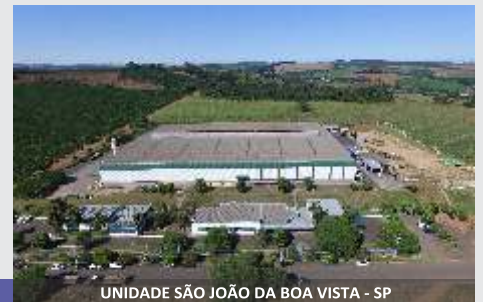
UNIDADE SÃO JOÃO DA BOA VISTA - SP

Linha de Mixers JF, a solução para o produtor!