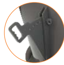
2 CONTRA CUCHILLAS CON 5 POSICIONES DE AJUSTES