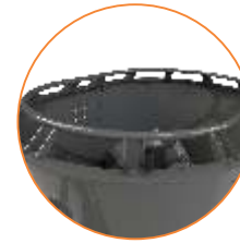
SOBREGUARDIA PARA HENO