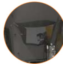
PUERTA DE ALIMENTACIÓN PARA ADICIÓN DE INGREDIENTES