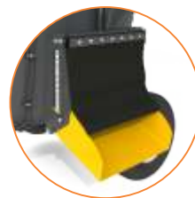
DESCARGA POR PUERTA