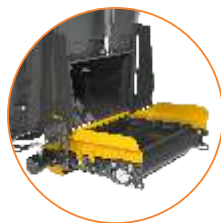
DESCARGA POR BANDA (opcional)