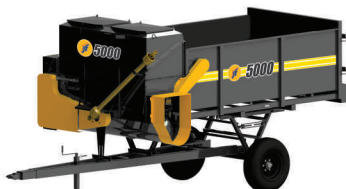
JF 5000 com dosador (opcional)